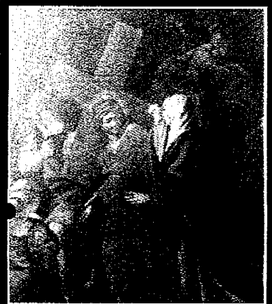
Le immagini delle due tele rubate, appartenevano alle stazioni 5 e 6 della Via Crucis